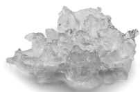
EF 124 EASY FIT Lód płatkowy typu Flake. Zawartość wody 25%